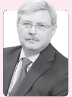
Сергей Жвачкин, губернатор Томской области

Желаем вам крепкого здоровья, счастья, тепла в семье и весны в душе!