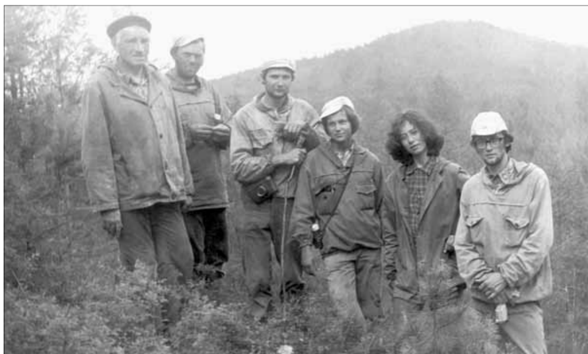
■ Участники комплексной самодеятельной экспедиции по изучению Тунгусского метеорита на горе Фарингтон в эпицентре Тунгусского взрыва (1978 год)

О том, что это был именно внезапный вывал тайги, а не послепожарная сукцессия, говорят пониженное содержание микроугольков, найденное в этих образцах, и находка специфических микрообъектов с никелевым напылением, образовавшихся при высокотемпературном воздействии космического тела на земные частицы. Насколько масштабным было это событие и могло ли оно стать причиной последующих климатических изменений Земли, начавшихся после 5 тыс. лет назад? Эту загадку ученым еще предстоит разгадать.