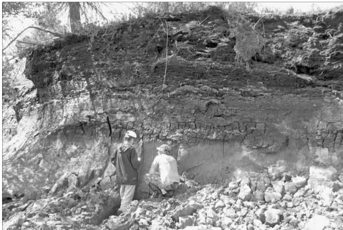
■ Извлечение монолитов торфа из зачистки торфяника для последующих палеоэкологических и геохимических анализов