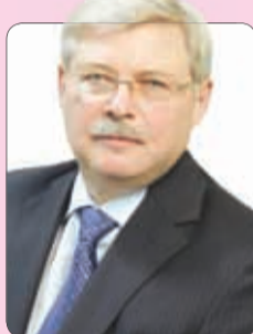
Сергей Жвачкин, губернатор Томской области

Светлое Христово Воскресение – главный христианский праздник. Он учит нас важнейшим законам жизни – любви, прощению, состраданию, вере в добро. На эти основы больше двух тысяч лет опирается мир.