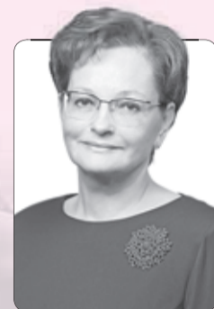
Оксана Козловская , председатель Законодательной думы Томской области