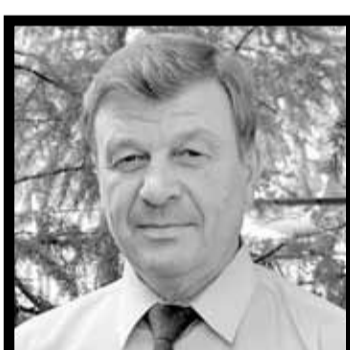
Владимир Иванович родился в 1946 году в селе Богородском Хабаровского края. Выпускник Канского технологического техникума

ма, в 1969-м он приехал в Томскую область, где до 1987 года прошел путь от старшего механика до заместителя директора Нарымской славной конторы комбината «Томлес» в селе Тогур Колпашевского района.