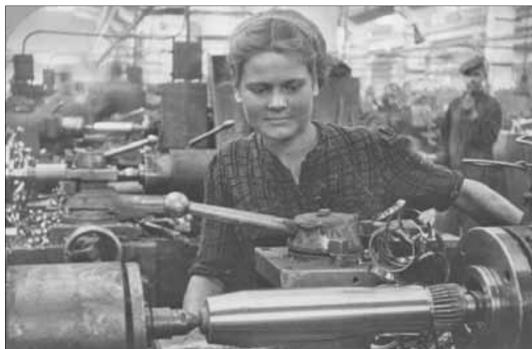
■ За станками стояли подростки, им приходилось вставать на ящики, чтобы дотянуться до рычагов управления

Небольшие предприятия местной промышленности и артели (всего 56) стали отправлять на фронт в условиях жесточайшего дефицита фондов на материалы малые партии различных изделий. Сырьем было то, что под рукой: древесина, металл, продукты сельского хозяйства. Весовой завод изготавливал топоры, катушки, котелки чугунные, ремесленное училище № 10 – инструмент (плоскогубцы, пилы), артель «Канат» – веревку. Артель «Бондарь» клепала бочки, спичфабрика – тару для снарядов, «коктейль Молотова», артель «Культспорт» – лыжи, ложки деревянные, белье, артель «Единение» – гимнастерки, телогрейки, ватники. В целом все, что могли производить томские умельцы