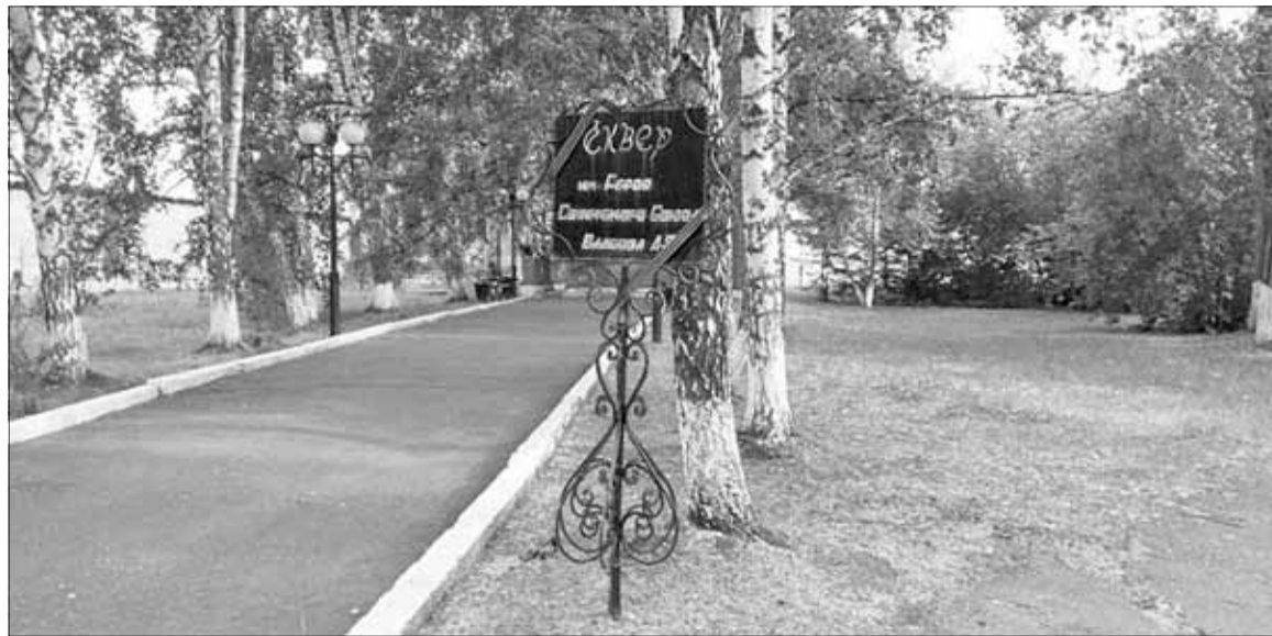
■ Сквер имени А.Я. Власова на улице Нахимова, около ИК-4

В органах МВД служил с 30 мая 1947 года по 7 июня 1964 года. Последнее время был начальником отряда в ИТК-4. Среди личного состава и осужденных пользовался авторитетом и уважением. Когда осужденные письменно обращались к начальнику отряда, они почти всегда писали: «Начальнику отряда Герою Советского Союза Власову». Тем самым