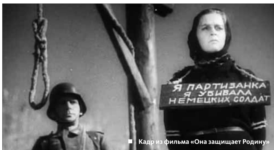
■ Кадр из фильма «Она защищает Родину»