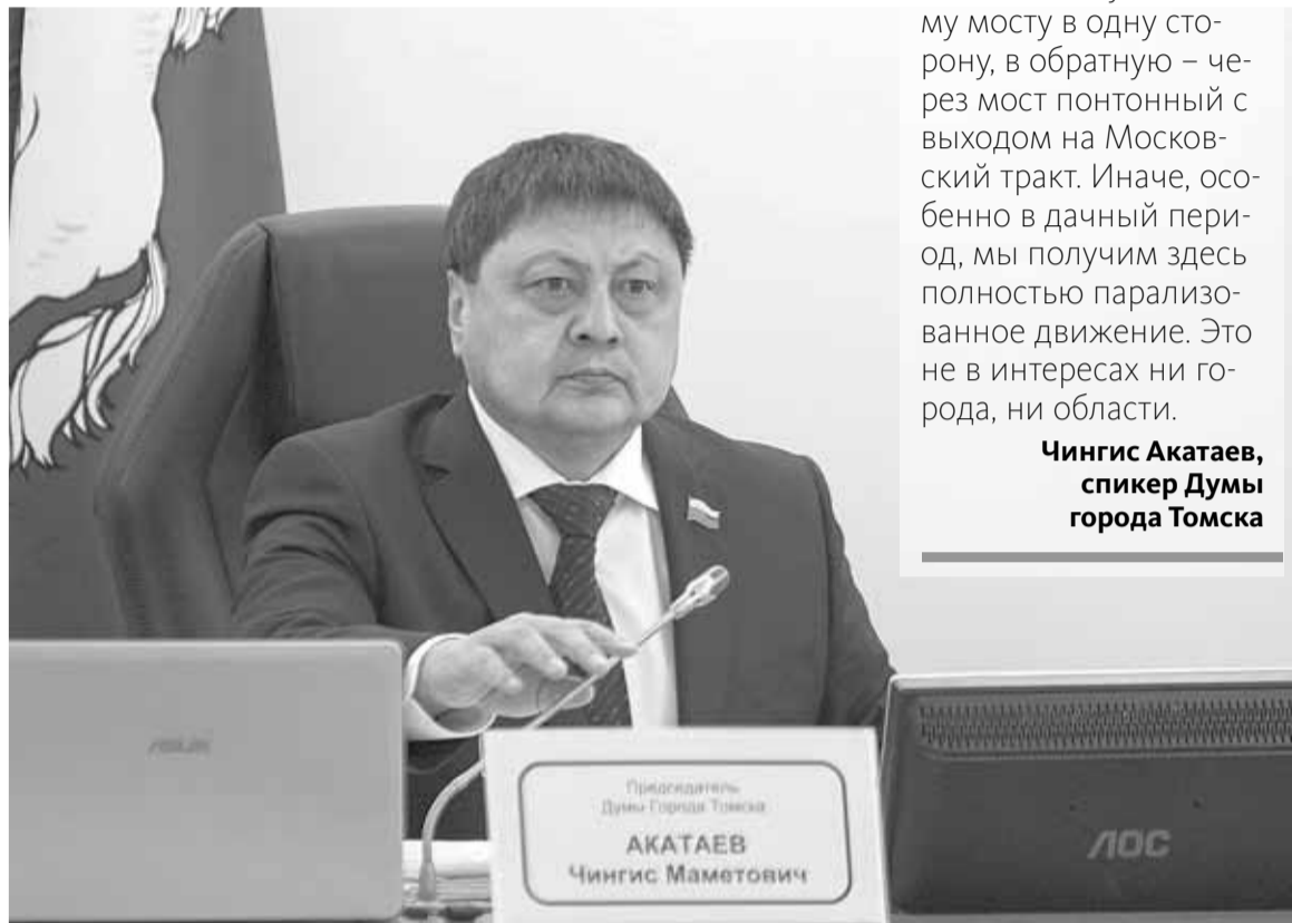
Чингис Акатаев, спикер Думы города Томска

Чингис Акатаев подчеркнул: левобережье – это не только студенческий кампус, это также инфраструктура.