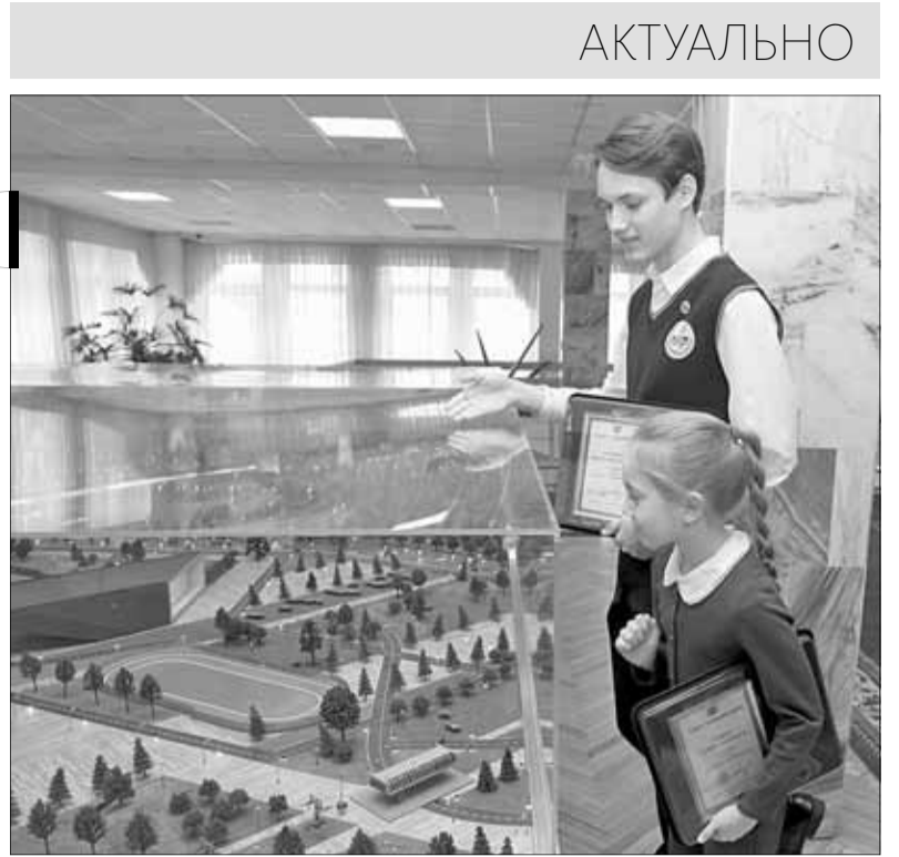
■ Макет будущего кампуса