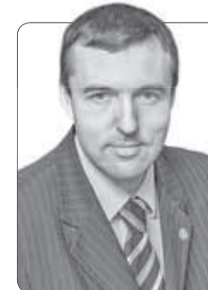
Николай Бохан, директор НИИ психического здоровья, академик РАН:

– ИЗ ОБРАЩЕНИЯ губернатора я впервые узнал цифры о мобильности томичей. Они впечатляют.