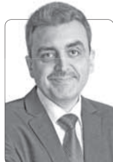
Эдуард Галажинский, ректор ТГУ, депутат Законодательной думы Томской области:

– НАМ В ТОМСКЕ непросто соблюдать режим самоизоляции: эпидемиологическая обстановка вроде бы спокойная, да еще и погода радует ранней солнечной весной. Я очень понимаю студентов, которым меньше всего сейчас хочется сидеть в помещении, но очень надеюсь на их благоразумие и чувство ответственности за близких. Объявленный губернатором режим самоизоляции, который мы всячески поддерживаем, дает надежду, что регион минуют страшные последствия