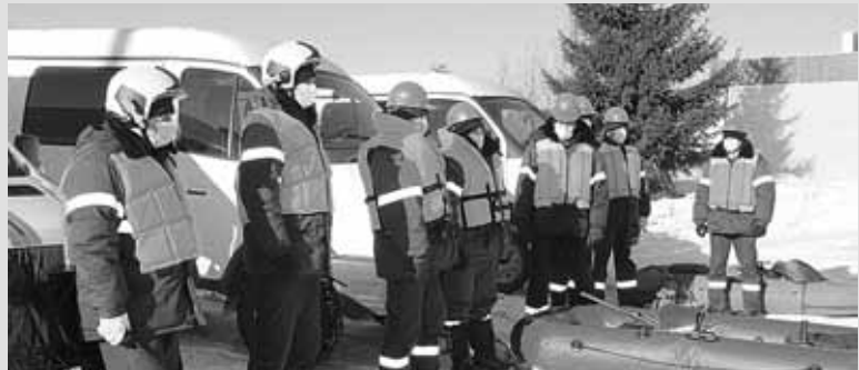
Компания «Газпром газораспределение Томск» завершила подготовку газораспределительной системы к паводку, что позволит обеспечить бесперебойное и безаварийное газоснабжение промышленных, коммунально-бытовых предприятий и населения в весенний период.

Если обнаружены какие-то неисправности, необходимо немедленно сообщить в АДС ООО «Газпром газораспределение Томск» по телефону 04 (с сотового – 104).