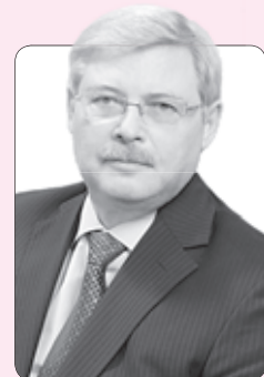
Сергей Жвачкин, губернатор Томской области

Желаем вам крепкого здоровья, счастья, неиссякаемого вдохновения, творческих успехов и новых поклонников!