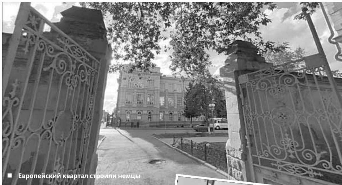
■ Европейский квартал строили немцы