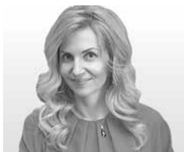
■ Анна Ярославцева

Немецкой фамилией в Томске никого не удивить: в школе я училась с мальчиком Рольгейзером, а в вузе – с девочкой Фиц. Дальше российские немцы стали попадаться даже среди Ивановых и Вершининых. Пршлая перепись показала, что в регионе живет около 9 тыс. российских немцев, это четвертый по численности этнос после русских, татар и украинцев.