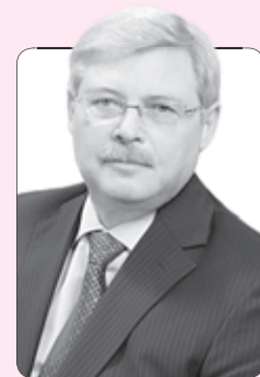
Сергей Жвачкин, губернатор Томской области

От всей души благодарим вас за ежедневный труд и верность традициям. Желаем неиссякаемого вдохновения и творческого долголетия, счастья, здоровья и всего самого доброго!