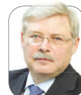
Сергей Жвачкин, губернатор Томской области

« Русское географическое общество – это организация, которая имеет многовековую историю, но ее дальнейшее развитие зависит от регионов – к этому мы намерены приложить свои силы. Тем более что каждый из нас в детстве зачитывался книгами об исследователях, мечтал о путешествиях, хотел быть капитаном. К сожалению, с возрастом это забывается. Я считаю, пришло время популяризировать деятельность одной из старейших в стране общественных организаций.