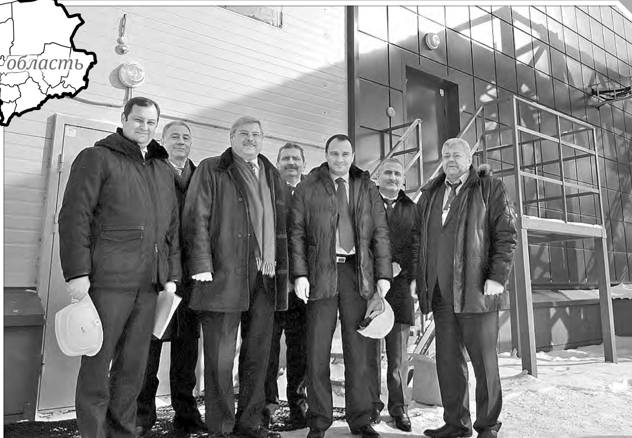
■ Дмитрий Кузнецов