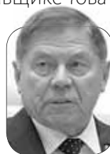
Вячеслав Лебедев, председатель Верховного суда РФ

“ Все это непростое время наши суды работают, не снижая темпов, в обычном режиме. Подчеркну особую роль президиумов Верховного суда и Совета судей, которые в самом начале эпидемии оперативно приняли постановления о порядке работы судов и в дальнейшем регулярно давали разъяснения по вопросам, возникающим в связи с пандемией.