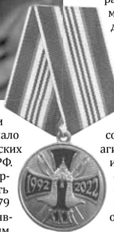
■ Юбилейная медаль «30 лет частной охранной и детективной деятельности России»

сейчас трудоустроено около 7 тыс. охранников.