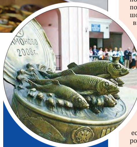
■ Летом 2008 года в городке Мамоново Калининградской области открыт памятник шпротам

За победу в экспертизе «ТН» продолжили борьбу четыре участника, в том числе два образца сорта экстра одного изготовителя из Калининградской области.