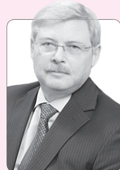
Сергей Жвачкин, губернатор Томской области

Законы – это правила, по которым живет государство и его граждане, развиваются экономика и социальная сфера, растет благосостояние людей.