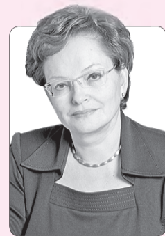
Оксана Козловская, председатель Законодательной думы Томской области

Желаем вам быть объективными и мудрыми, стоять стеной на страже закона и порядка, беречь традиции томской прокурорской школы. Крепкого вам здоровья, счастья и всего самого доброго!