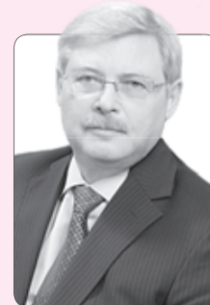
Сергей Жвачкин, губернатор Томской области

Желаю представителям ока государства и вашим семьям всего самого доброго!