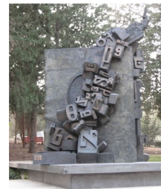
Берлин (Германия) Памятник "Der moderne Buchdruck" установлен в честь отца современного книгопечатания Иоганна Гутенберга.