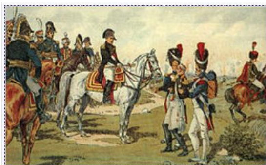
Отказ пленного русского генерала П. Г. Лихачева принять шпагу из рук Наполеона. Хромолитография А. Сафонова. Начало XX века.

В 1758 г. в дворянской семье, владевшей этой деревней (двадцать крепостных «душ»), и родился будущий генерал. Как и полагалось в те времена, военную службу начал с 14 лет. Служил во 2-м фузилерном полку (fusilier - стрелок из фузеи, ружья) фурьером, т. е. унтер-офицером, занимавшимся распределением мест постоя, размещением личного состава роты. Долго тянул унтер-офицерскую ляжку, участвовал в покорении Крыма, лишь в 1784 г. получил первый офицерский чин. В русско-шведской войне 1789-1790 гг. служил в артиллерии гребного флота. Отличился в Роченсальмском сражении, стал капитаном. В 1793 г. переведен в Кубанский егерский корпус. В 1797 г. произведен в полковники и назначен командиром полка, дислоцировавшегося в районе нынешнего Пятигорска. Города-курорта тогда еще не существовало, но лечебные источники были известны, и люди ездили сюда «на воды». Охрана лечебного района от разбойников была одной из задач полка.