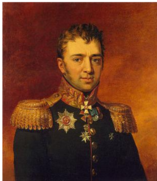
Портрет генерал-майора П. Г. Лихачёва мастерской Джорджа Доу. Военная галерея Зимнего Дворца, Государственный Эрмитаж (Санкт-Петербург)

Утром 26 августа 24-я пехотная дивизия, которой командовал Лихачев, находилась в резерве. В разгар сражения Барклай направил ее на Курганную высоту для обороны батареи Раевского, ключа всей русской позиции. Днем 150 орудий открыли огонь по батарее. Маршал Мюрат после двух неудавшихся атак приказал генералу Коленкуру, сменившему убитого в начале атаки командира кавалерийского корпуса генерала Монбрена, любой ценой захватить батарею. Кирасиры обошли Курганную высоту, но почти все, как и сам Коленкур, были уничтожены солдатами Лихачева. В этот момент Евгений Богарне бросил на штурм батареи с фронта и фланга польский «легион Висла» и другие пехотные части. В бою, уже внутри укрепления, Лихачев, исколотый, израненный, вместе с рядовыми солдатами отбивался от врага, и, не желая попадать в плен, бросился на французские штыки. Генеральские знаки различия остановили наполеоновских солдат,