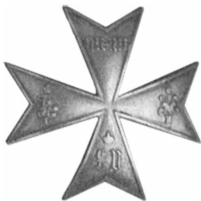
Нагрудный знак 39 пехотного полка