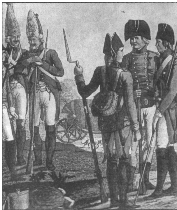
Русская пехота конца XVIII - начала XIX веков.

В третьем часу дня противник снова начал наступление. Три пехотные дивизии атаковали батарею с фронта, кавалеристы обходили ее с правого и левого флангов. Передовым частям французской кавалерии удалось ворваться на батарею. В это же время французская пехота устремилась на высоту