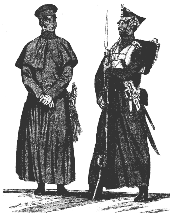
Обер-офицер и рядовой Томского пехотного полка, 1812 год.

В марте 1864 года полк назван пехотным Томским. А в мае 73-го Эрцгерцог Австрийский Людвиг-Виктор стал шефом полка, и с этого времени полк стал называться 39-м пехотным Томским его Императорского высочества Эрцгерцога австрийского Людвиг-Виктора.